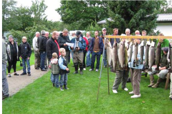
Billede fra præmieuddelingen.

den anden blev fanget af undertegnede lørdag eftermiddag.