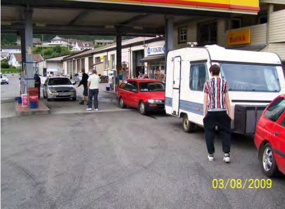
Campingkaravanen på vej hjem.