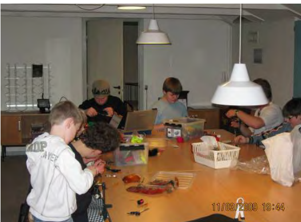
Billede fra sidste vinter i klublokalet.