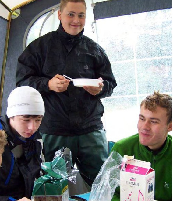
Morgenmad (selvglade lystfiskere).