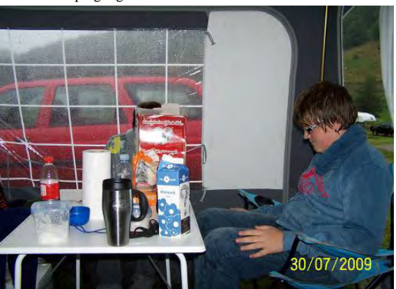
Tørvejr i forteltet, formanden havde heldigvis taget campingvognen med..