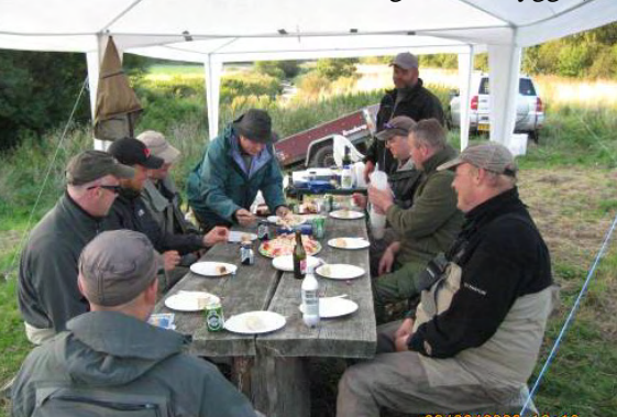
Fra rød zone, fredag aften.

Der var nogle foretagsomme mennesker der benyttede lejligheden til en hyggeaften og nat på vores egen eng i toppen af rød zone. De fik selvfanger fisk (røget og ikke fra denne aften for der blev ikke fisket meget, mest hyget).