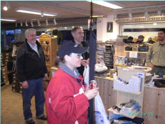
Billede fra tur til Grejbiksen den 20. april.

Traditionen tro sluttede junioraftenerne med weekend-tur til Gjerrild den 28-30. april. Det var desværre lidt for tidligt til hornfiskene. Men en tur til Kanaløen lørdag, gav en del sild.