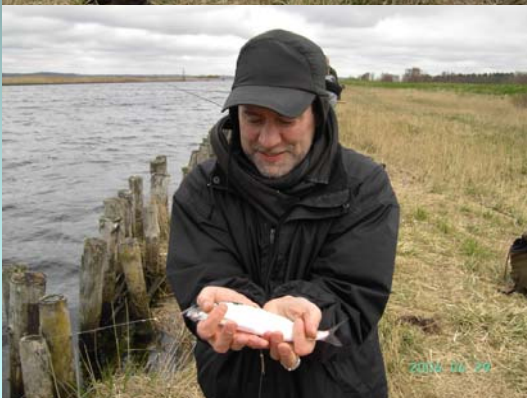
Børges første sild nogensinde.