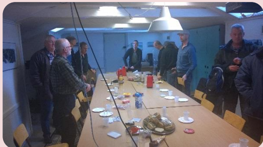
Morgenkaffe og snak i klublokalet.

Lørdag den 19. marts havde vi inviteret de nye medlemmer til rundvisning og lidt orientering om vores forening.