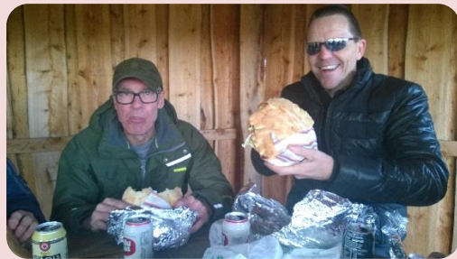
Bespising i Pavillonon.

Vi sluttede dagen af med de store lækre pita-brød fra Winner Burger. Lidt madkultur fra Langå, må vi jo også have med. Ikke alle kunne spise op.