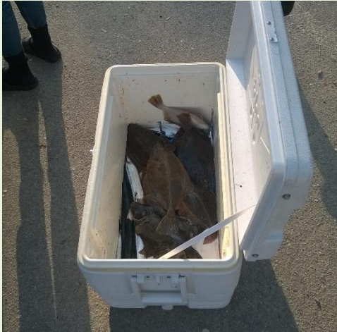
Lørdagens fangst fra en af bådene.

Vi blev rigtig forkælede med frisk morgenbrød frit leveret hver morgen af Kim, vi skulle bare have ost og smørret.