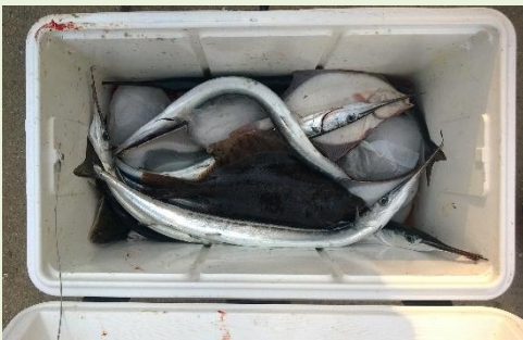
Endnu en fangstkasse.

Lørdag var den bedste dag med fiskeriet. Søndag blæste det lidt for meget, og det blev ikke til meget denne dag.