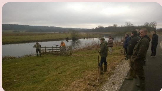
Fra rundturen ved Jernbanesvinget.

Det var 16 deltagere i år. Det er et passende antal, for 2 år siden var der næsten også for mange til, at vi kunne være i klublokalet og efterfølgende køre rundt.