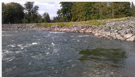
Sådan kunne Gudenåen se ud, hvor Tangeværket ligger i dag.

Alene ud fra en etisk betragtning: ”om at hvad man på et tidspunkt har lånt, leverer man tilbage i den forfatning, som man i sin tid lånte det”, så burde moralske og ansvarlige beslutningstagere allerede have sørget for at befri Gudenåen, da Tangeværkets tidsbegrænsedes tilladelse udløb kort efter årtusindeskiftet.