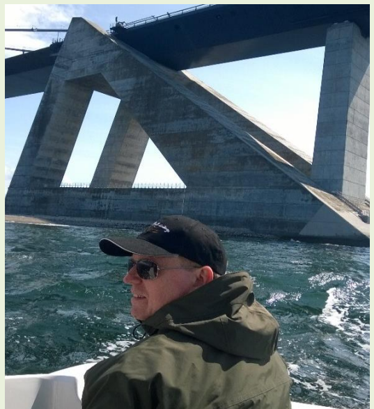
En mand og hans bro 😊