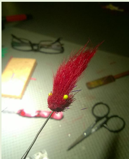
En af Kim's favoritter, til laks i Gudenåen.