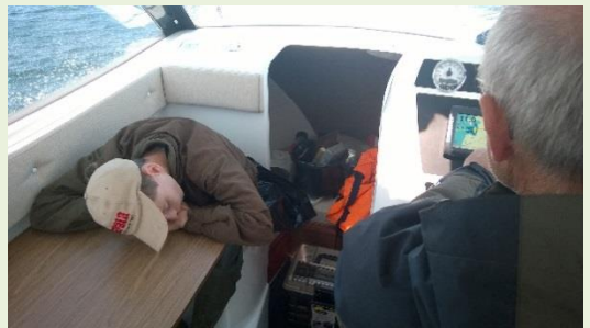
En lystfisker kan også blive træt.

Lørdag var vejret fint, der var dog så meget vind, at vi ikke kunne fiske på nordsiden af broen. Vinden kom fra nord.