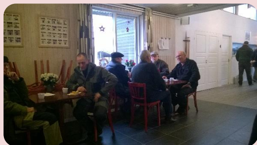
Fra den hyggelige morgen.

Som sidste år den 1. marts, havde Langå Camping, inviteret os medlemmer på morgenkaffe.