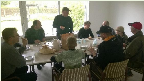
Morgenmaden indtages, før afsejling.

Vi blev indkvarteret i deres nye klublokaler. Det er nogle rigtige fine lokaler, med masser af plads. Lokalerne har de sammen med Nyborgs Naturskole.