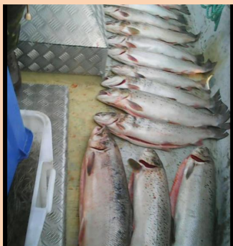
Vi skal have det ulovlige fiskeri stoppet i Fjorden! Dette billede stammer desværre fra en omgang ulovligt fiskeri i fjorden!

Så derfor fortsætter arbejdet med at få fjernet de ulovlige garn i fjorden, og der er flere tiltag i støbeskeen, blandt andet et borgermøde i en af byerne ved fjorden! Dette vil der komme mere nyt om i løbet af efteråret/vinteren.