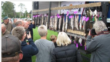
Laksen tiltrækker opmærksomhed.

Den oprettede styregruppe tilbage i 1987 var ikke en organisation, som kommuner, foreninger og privatpersoner kunne samles om. Derfor tog nogle af folkene bag styregruppen fra 1987 initiativ til dannelsen af Gudenåssammenslutningen Lakseprojektet. Intentionen var (og er) at skabe bred opbakning til målet om, at gøre Gudenåen selvreproducerende for ørreder og laks.