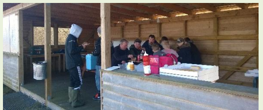
Ovenfor er det spisning. Nedenfor ses fangsterne.