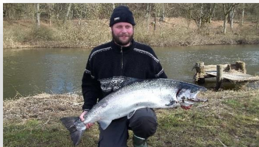
Laksedrømmen for os alle.