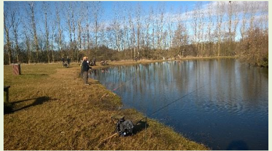
Vejret var fint, som det ses.

Hver klub, skulle skaffe præmier til vinderne. Det blev nogle fine præmier. Fiskestænger, tasker, flotte flueæsker mv.