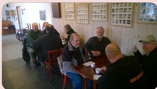
Endnu fra den hyggelige morgen.

Selv om dagen den 1. faldt på en tirsdag, var der rigtig mange, som mødte op