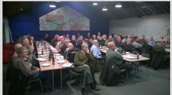
Billede fra salen.

Hvad angår Tjærbækken og Brandstrup Bæk er der et markant fald i ørredtætheden i de senere år. Det er bekymrende.