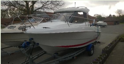
Så er der linet op til fiskeri.

Vi blev indkvarteret i deres nye klublokaler. Det er nogle rigtige fine lokaler, med masser af plads. Lokalerne har de sammen med Nyborgs Naturskole.