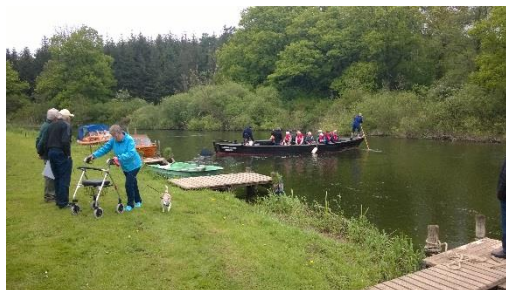
Kågesejls, på åen.

Desværre havde vores "nye" lokalavis ikke gjort meget reklame for dette. Det kunne ses på antal borgere, der kom. Det skal en lokalavis gøre bedre.