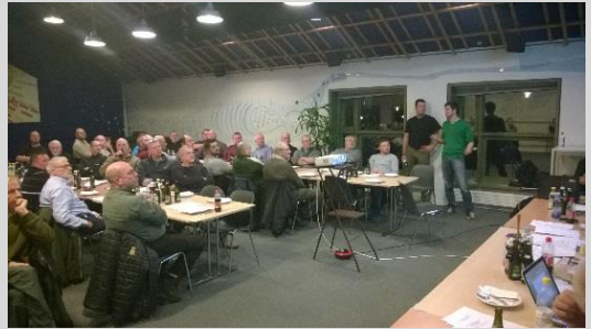
Billede fra salen.

Alle modtager genvalg. Der var genvalg til alle.