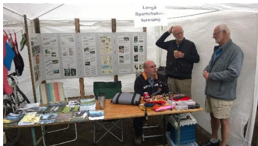
LSF's stand på pladsen.

De forskellige foreninger i Langå fik tilbudt en stand på pladsen, for at gøre lidt reklame for sig selv. Dette benyttede vi os også af i LSF.