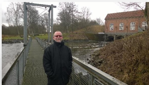
Tangeværket tiltrækker stadig både negativ og positiv, opmærksomhed.