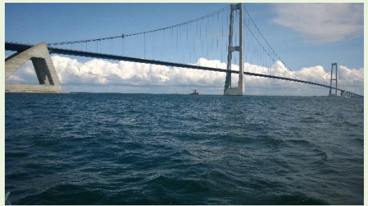
Vejret var fint lørdag trods lidt vind.

Lørdag var vejret fint, der var dog så meget vind, at vi ikke kunne fiske på nordsiden af broen. Vinden kom fra nord.