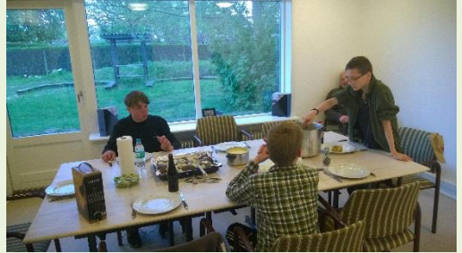
Bøfferne indtages, af sultne fiskere.