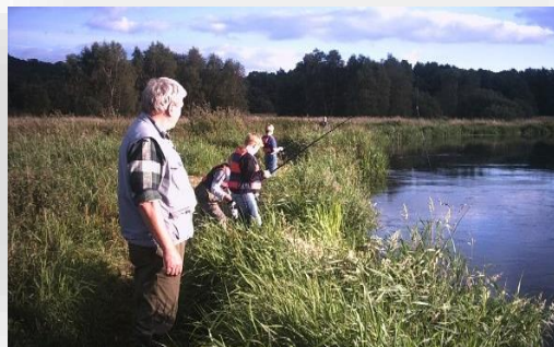
Børne hygge, ved Gudenåen. Det rekreative fiskeri, har mange værdier.

På en eller anden måde fik folketingspolitikerne besluttet, at det måtte politikere i lokalområdet tage endelig stilling til med henvisning til, at det var og er en lokal problemstilling. Men hvor ”lokal” er denne problemstilling egentlig? Er det blot et anliggende for den enkelte kommune, som Gudenåen tilfældigvis lige løber igennem på det sted, hvor muren deler Gudenåen? Eller er det alle kommuner, som Gudenåen gennemløber? Eller burde det være et nationalt anliggende med tanke på naturgenopretningen af Skjern Å (som dog ikke er så langt et vandløb)?