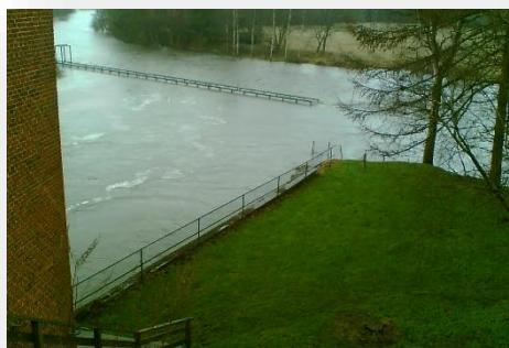
Ikke mange fisk der kommer forbi her.

Der er endvidere blevet brugt utallige skatte kroner på et sagligt og fagligt beslutningsgrundlag og høringer, som politikerne på Christiansborg kunne tage udgangspunkt i, da de skulle beslutte fremtiden for Gudenåens forløb ved Tange for snart 15 år siden. Af en eller anden grund turde vores folkevalgte politikere ikke træffe en reel beslutning om Gudenåens fremtidige forløb ved Tange - og det endda selvom en reel naturgenopretning af Gudenåen allerede var udeladt i det udarbejdede beslutningsgrundlag (Skal læses: Droppe opstemningen af Gudenåen og reetablere Gudenåen).