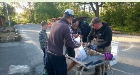
De voksne fik tjansen, med at rense fisken.

Vi var jo en del, der håbede på, at sejen ville være der, som den var sidste år. Men den var der desværre ikke, hverken lørdag eller søndag.