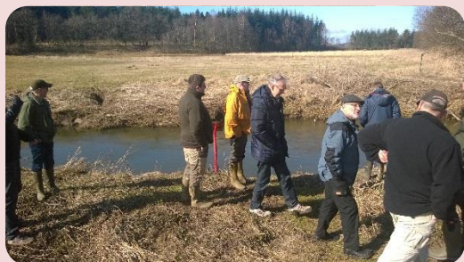
Her ved Rød Zone, Lilleåen.

Vi havde en rigtig hyggelig dag, og vi håber også, at de nye, som var med, lærte foreningen bedre at kende. Vi kom godt rundt på vores fiskevand. Vi så også nogle af de små gydebække.