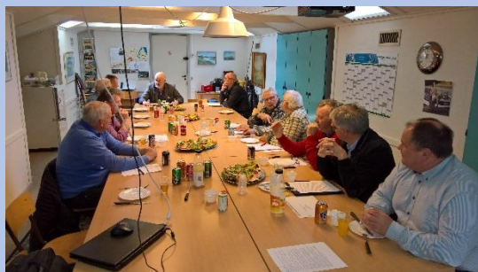
Fra forplejningen før generalforsamlingen.