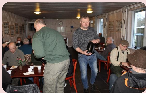
Endnu et billede fra den hyggelige morgen.

Selv om dagen den 1. faldt på en onsdag, var der rigtig mange, som mødte op - næsten 50.