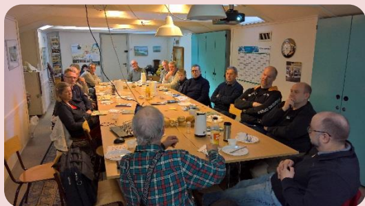
Morgenkaffe og snak i klublokalet.

Lørdag den 25. marts havde vi inviteret de nye medlemmer til rundvisning og lidt orientering om vores forening.