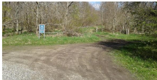
Det er her, man kører ind.

Indkørslen til pladsen er ad Mosevej, det er den vej, der går ned forbi rensningsanlægget. Vil man bruge GPS skal man indtaste 8870 mosevej 22. Så kommer man ind på vejen, når man kommer til 22 skal man holde til højre, ellers ender man i en indkørsel, fortsæt af vejen langs rensningsanlægget.