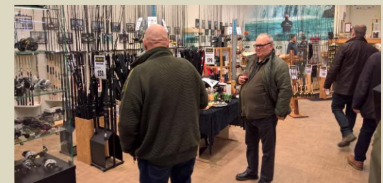
Mon Otto har råd?