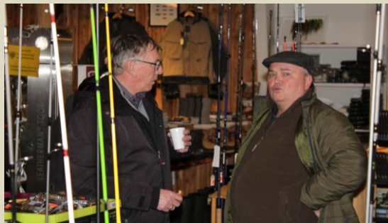
Hovsa, han var også her ☺.