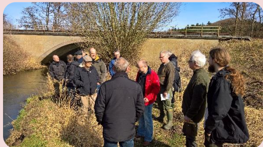
Her ved Rød Zone, Lilleåen.

Vi kom godt rundt på vores fiskevand. Vi så også nogle af de små gydebække.