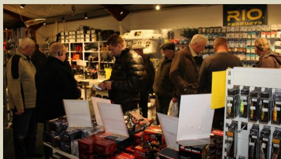
Hov det mangler jeg vist lige.