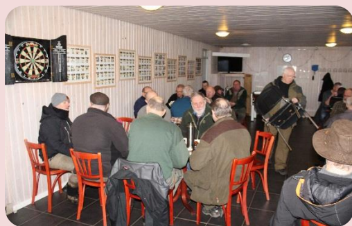
Fra den hyggelige morgen.

Som sidste år den 1. marts, havde Langå Camping inviteret os medlemmer på morgenkaffe.