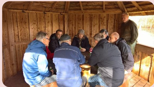
Bespisning i Pavillonen.

Vi sluttede dagen af med de store lækre pitabrød fra Winner Burger. Lidt madkultur fra Langå, må vi jo også have med. Ikke alle kunne spise op.