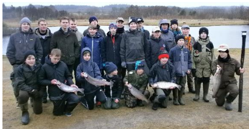
Fra Fælles junior konkurrence.

Der er dømt røde kinder, jord under neglene og vind i håret for fremtidens skolebørn. I hvert fald hvis det står til Danmarks Jægerforbund og Danmarks Sportsfiskerforbund. Sammen har de to organisationer skabt projektet Bliv NaturligVis, der fra 2017 vil samle undervisningsmaterialer og formidle kontakten til frivillige jægere og fiskere, der står klar til at rykke ud på skolerne. Den digitale platform er tilgængelig, og de frivillige formidlere kun et klik væk. Projektet tager udgangspunkt i den kærlighed til naturen, som ligger dybt begravet i størstedelen af de danske lystfiskere og jægere. Med den i hånden og lys i øjnene, tager de børnene med på en naturrejse fra den spirende naturpleje/vandløbspleje, over til fangsten af en fisk og til nydelsen i det gode måltid, der følger. Forinden har eleverne gennemgået en dag, en uge eller et projektforløb med deres lærer.