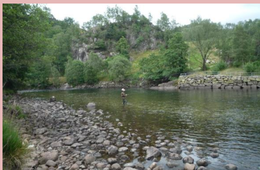
Ensom Laksefisker fra 2015 i Norge.

Tilmeld jer nu eller snarest så vi kan bestille færge, overnatning mv.