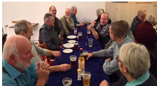
Fra afslutningen 2016.

Mød op og vær med til en god og hyggelig markering af afslutning på sæson 2017.