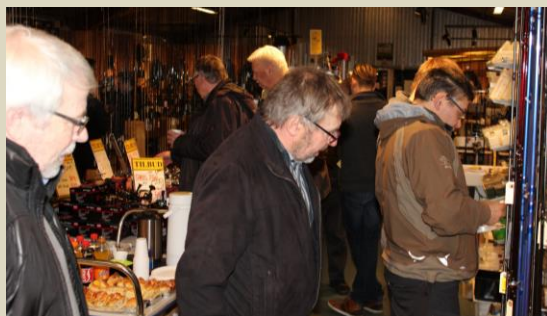
Der kigges på ny stang.