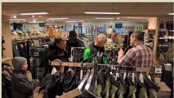
Der prøves tøj.