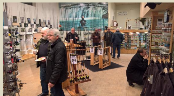
Måske ny stang og hjul.