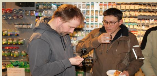
Mon konen opdager jeg kommer hjem med det.