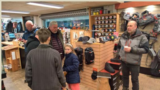
Der oses i Grejbiksen.

Herunder billeder fra aftenbesøget hos Lyst- fisk.dk i Randers. Torsdag den 2. marts.