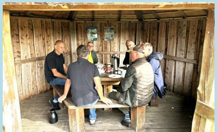
Den første gang veteranerne mødtes med rundstykker kaffe og en lille en til halsen.

Der er faktisk på vores ture fanget laks, havørred og gedder. Der er også mistet fisk – sådan kan det jo gå – men modet er ikke tabt på trods heraf.