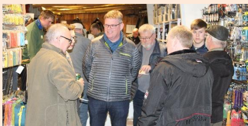
Snakken og handleerne var der også gang i, både på billedet over og under. 😊