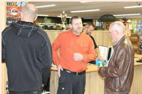
Ronnie giver gode råd.

Herunder billeder fra aftenbesøget i Grejbiksen i Trige, torsdag den 07. marts.