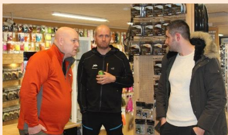
Der udveksles, lystfiskerhistorier.