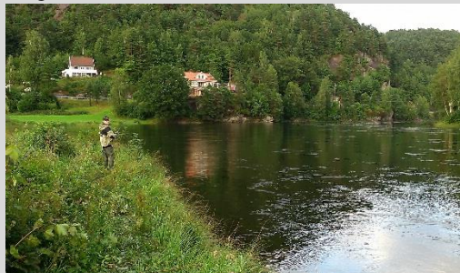
Fra Norge 2017.

Vi er nødt til at have betaling og bindene tilmelding, af hensyn til bestilling af færger overnatning mv.