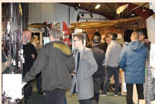
Der var mange i butikken også visse lokale berømtheder, som der ses her under.