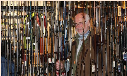
Verner gemmer sig bag Lystfisk.dk's mange stænger

Herunder billeder fra aftenbesøget hos Lystfisk.dk i Randers. Torsdag den 28. februar.