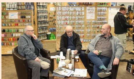
Der var også tid til kaffe.

Der bliver noget at leve op til, for den nye ejere af Go-Fishing. Det bliver for mange svært at undvære Grejbiksens varesortiment.