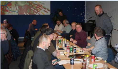
Fadene med smørrebrød er ved at være tømte

Projektet ved bådelaugget med offentligt toilet og faciliteter, der gør det mere imødekommende, samt handicapsti og handicap fiskeplatforme, er endelig faldet på plads, og forventes at gå i gang i foråret. Fiskepladserne havde jeg oppe som et forslag første gang i 2005, så det er jo fantastisk, at det endelig er lykkedes.