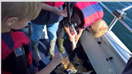
Fra sidste års Fyn tur.

Tilmelding denne tur senest den 5. juni.