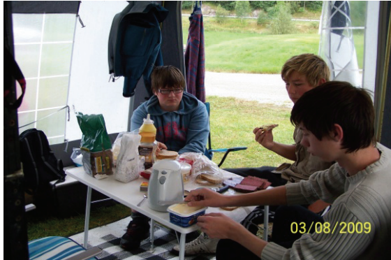
Billed fra Norge 2009

Resten af turen betaler LSF, incl færge, overnatning, mad fiskekort mv.