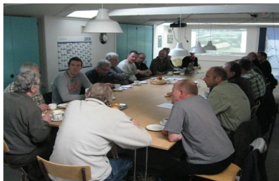
Billede fra sidste år.

Foreningen vil være vært med morgenkaffe og en let frokost.