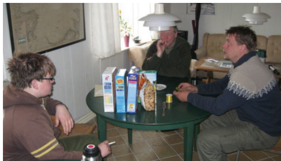
Billede fra sidste år.

Husk sovepose og madpakke til fredag aften. Vi mødes ved kulturhuset fredag kl. 16 00 . Vi regner med at være hjemme igen søndag kl.15. Eller I må gerne selv hente i Gjerrild senest kl.12.