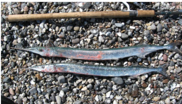
Fangst fra sidste år i Gjerrild

Husk det er gratis at deltage. I behøver ikke at have deltaget i klubaftnerne for at komme med på vores fisketure. Alle juniormedlemmer kan deltage.