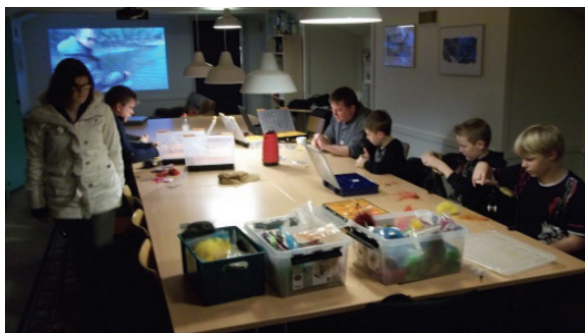
Billed fra klubaften.

Efter jul går vi tilbage til at holde klubaftener torsdage i ulige uger.