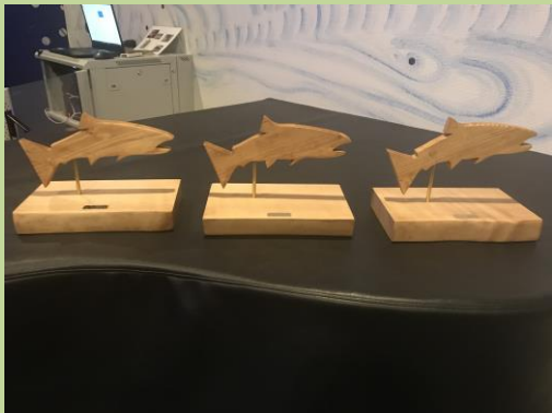
Tre fangster var på tale: Havørred, Laks og Gedde

Så kom tiden til pokaluddeling. På årets Generalforsamling 2023 blev der, som det sidste punkt, uddelt pokaler fra sæson 2022.