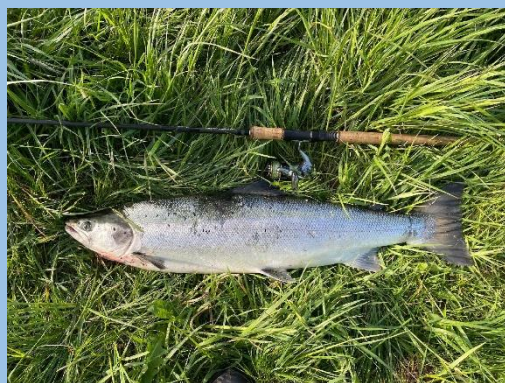
Jørgen Nielsen 89 cm 7,1 kg Grøn Zone Gudenåen