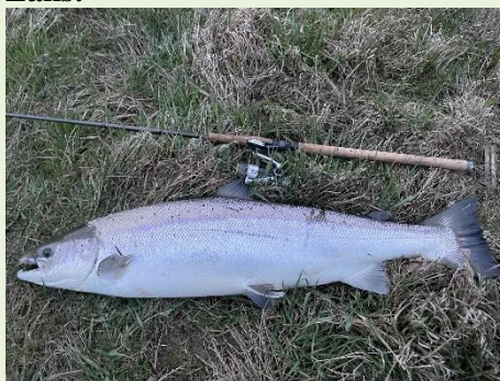
Karsten Boddum Olesen 93 cm 8,35 kg Grøn Zone Gudenåen